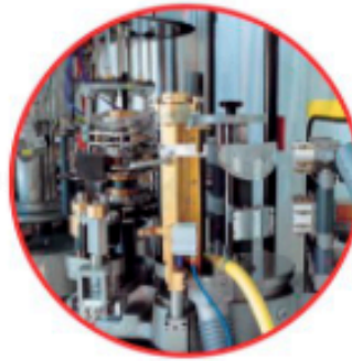
Cold glue labelling station Station étiquetage colle froide

The containers placed on the conveyor at the machine in-feed are spaced by an in-feed screw and transferred on the central carousel where they are positioned by platforms and there kept by press-cap heads.